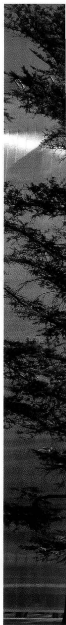
Pala minieolica Enel Green Pow